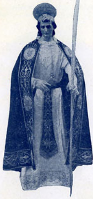
San Juan (Salzillo)

¿De proyectos? Muchos pero muchísimos. Ahora, que es muy pronto para darlos a la publicidad y queremos dar alguna sorpresa. Sin embargo le diré algunos. No todos ¿eh?