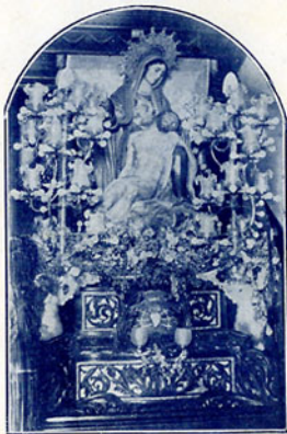
Virgen de la Piedad (Cajuz)

Lo recordando en las luchas, que los hermanos que poseen