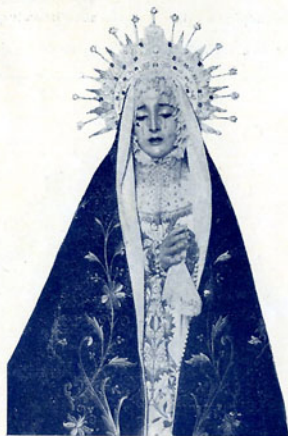
Virgen de la Soledad (Capuz)